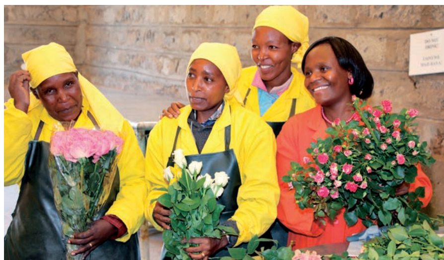
Les roses "Fairtrade" vendues par Cactus proviennent du Kenya.

Ces derniers sont distribués avec l'aide des assistances sociales aux personnes les plus démunies.