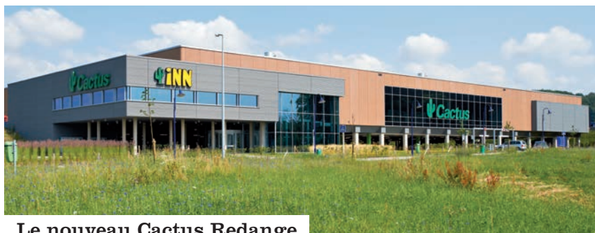
Le nouveau Cactus Redange

Le centre commercial la Belle Etoile est le plus vaste de la Grande Région avec 105 magasins.