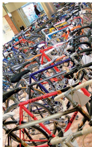
Le marché du vélo d'occasion attire chaque année de nombreux visiteurs.