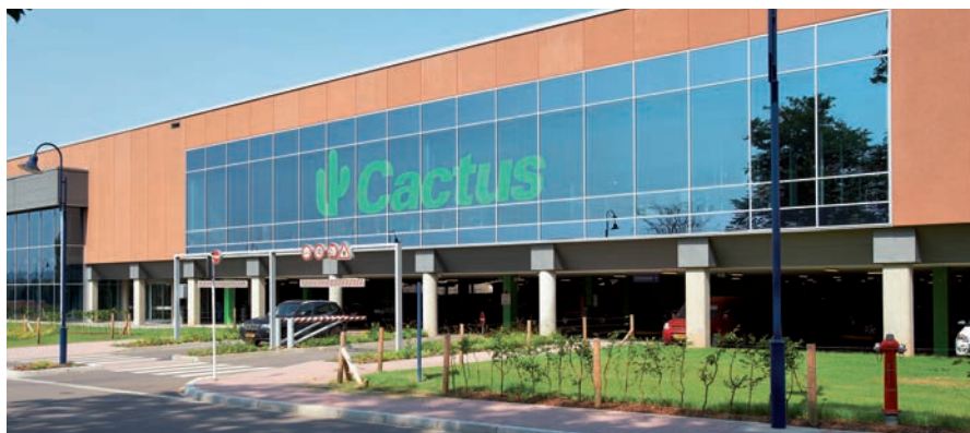
2012: L'enseigne Cactus de nos jours, le nouveau Cactus à Redange