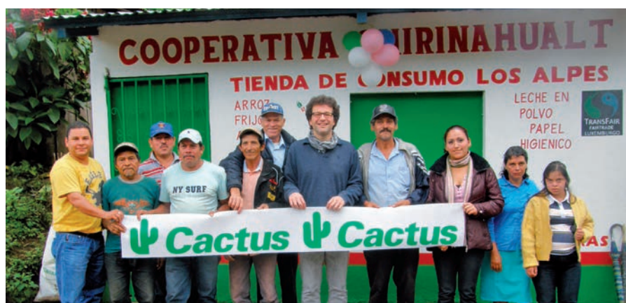
Inauguration de l'épicerie au Nicaragua.