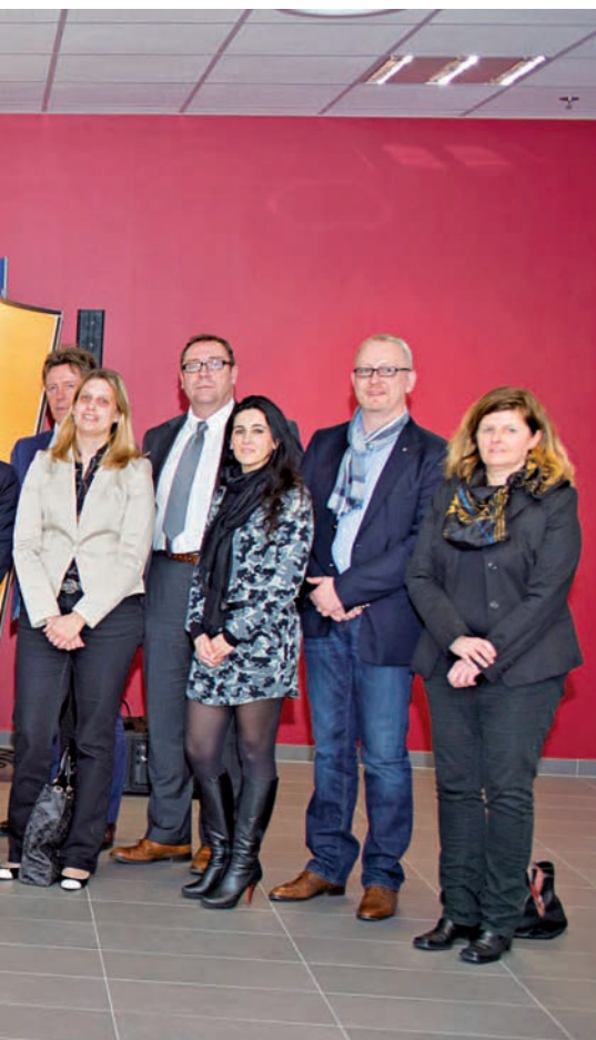
Cactus félicite ses apprenti(e)s.