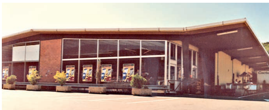
1967: Le premier supermarché de l'enseigne Cactus à Bereldange

Cactus présente une offre équilibrée entre produits nationaux et internationaux et a su ainsi satisfaire un large nombre de consommateurs du pays et de la Grande Région.