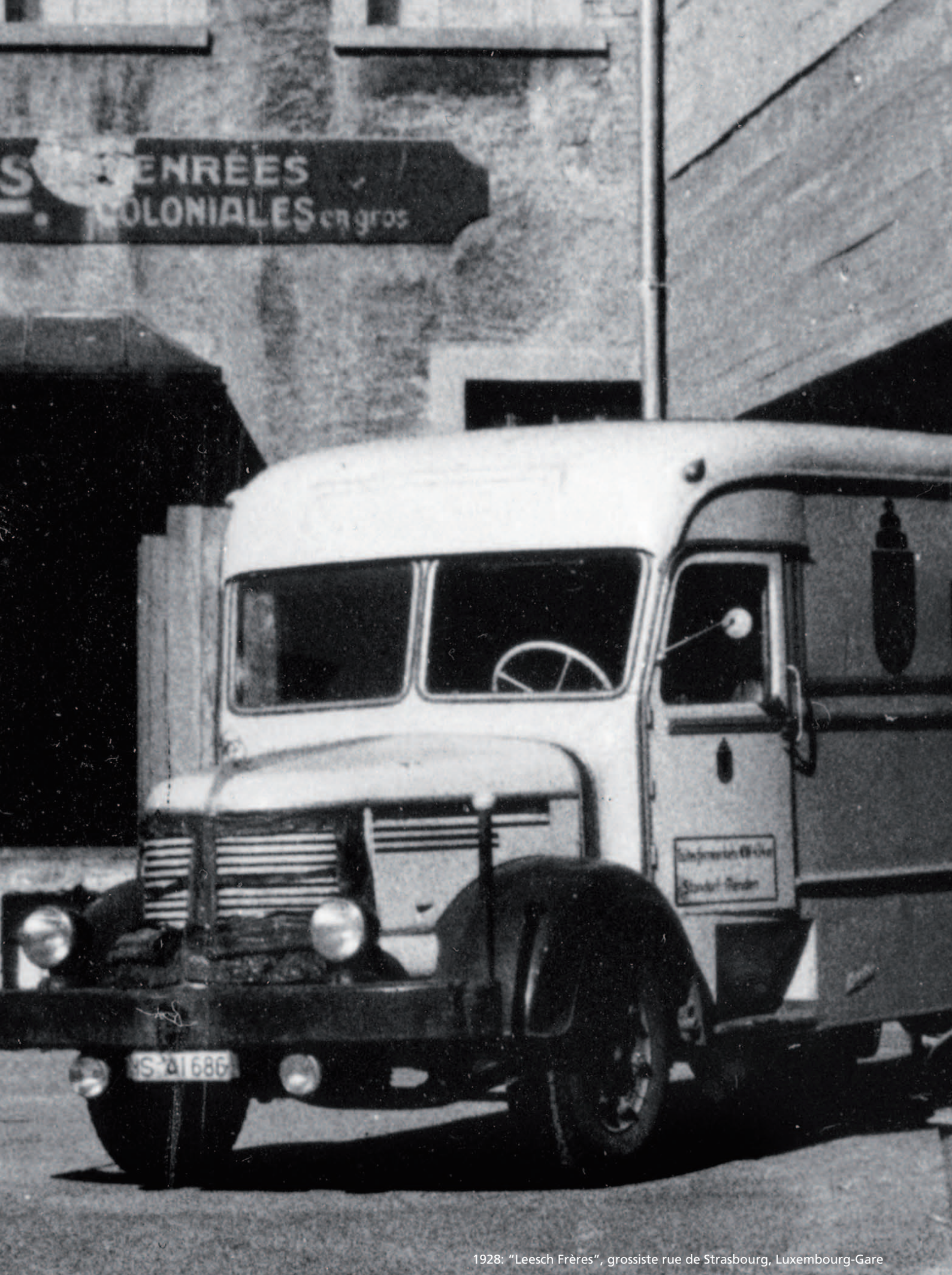
1928: "Leesch Frères", grossiste rue de Strasbourg, Luxembourg-Gare