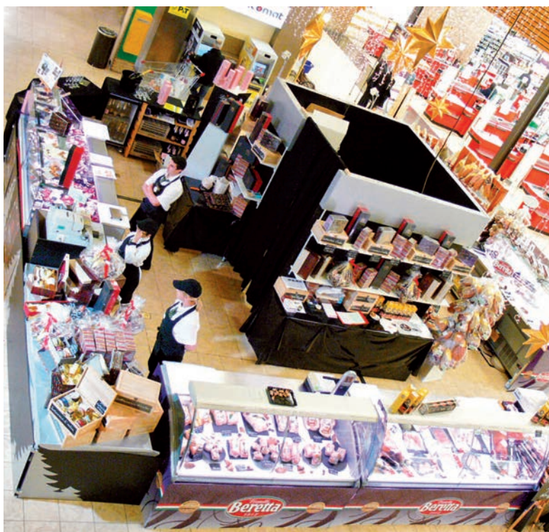
Avant les fêtes de fin d'année, les spécialistes de Cactus proposent la meilleure sélection de produits frais dans une ambiance conviviale et festive.