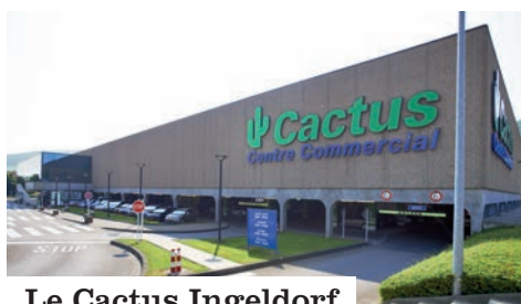
Le Cactus Ingeldorf