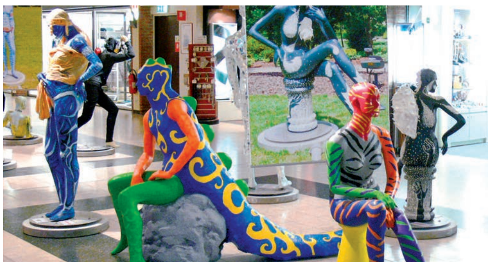
Pendant toute l'année, différentes expositions animent la galerie marchande et invitent les visiteurs à découvrir des œuvres d'art, des pays étrangers ou encore à partir à la chasse aux bonnes affaires.