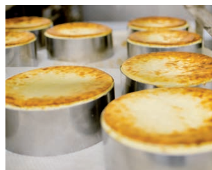
La tarte au fromage fait partie des meilleures ventes en pâtisserie.