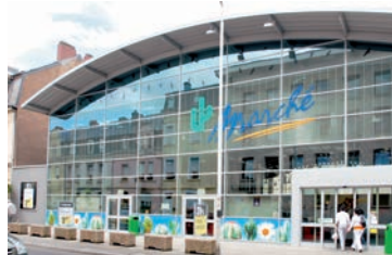
Le Cactus Marché Brill