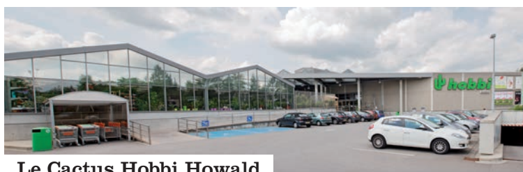
Le Cactus Hobbi Howald