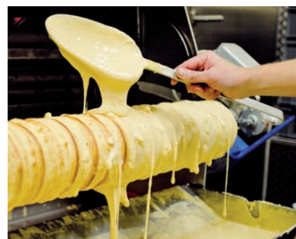
La fabrication du "Bamkuch", spécialité luxembourgeoise, nécessite un savoir-faire ainsi qu'une connaissance du produit et des machines de production adéquates.