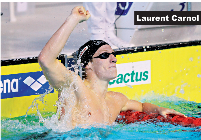
Laurent Carnol, meilleur sportif luxembourgeois de l'année 2013 et sponsorisé par Cactus depuis 2011.